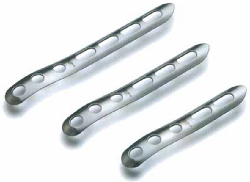
メイラフィブラプレート